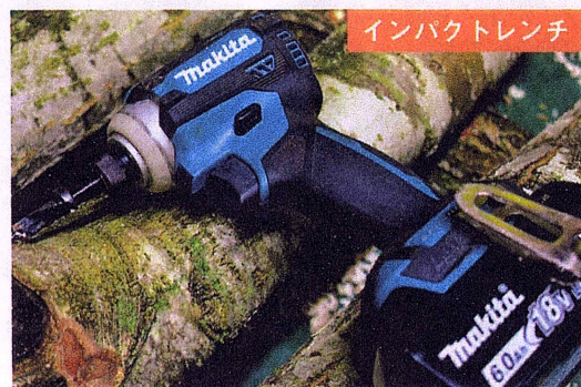
インパクトレンチ

畑やスギ林の草刈り用。チップソーなら中速で約1時間、 ビニールヒモの刃は抵抗が増えるので20～40分作業が 可能